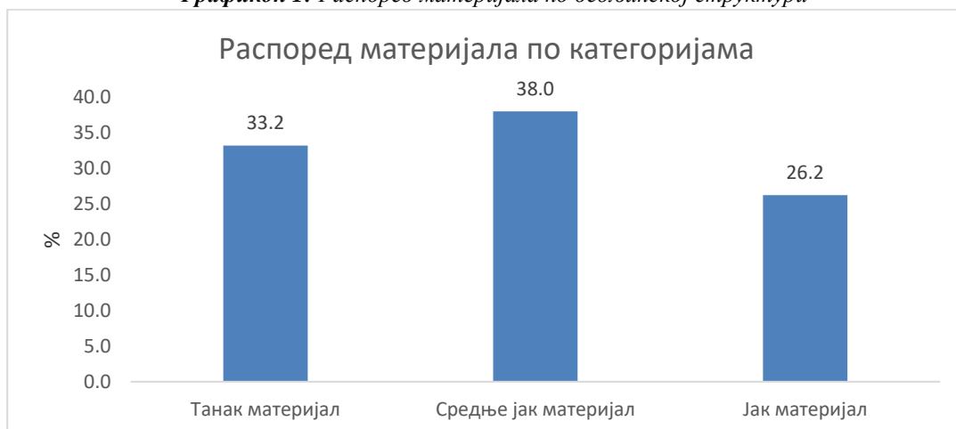
Графикон 1: Распоред материјала по дебљинској структури

Из графика се може видети да је дрвна запремина распоређена по категоријама на следећи начин: категорија танког материјала (30cm прсног пречника) у количини од 96.276,4m 3 (33,2%), средње јаког материјала (31 до 50cm) у количини од 110.234,1m 3 (38,0%) и категорија јаког материјала (преко 50cm) са 76.029,3m 3 (26,2%).